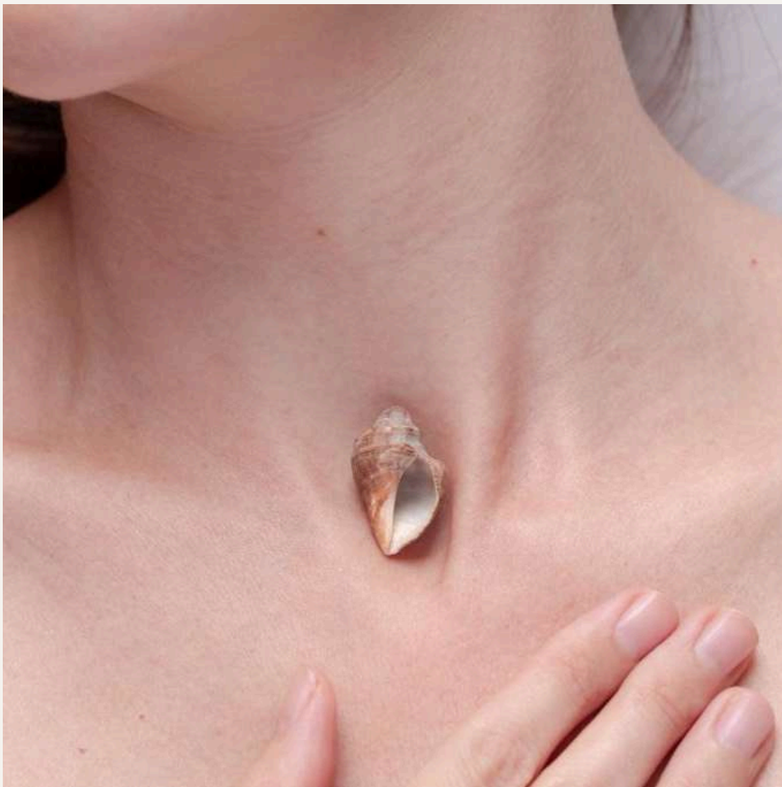
OBRA 03 Clara Mazini

Respiro: o renascimento da voz, fotografia digital, 2020 30x45cm